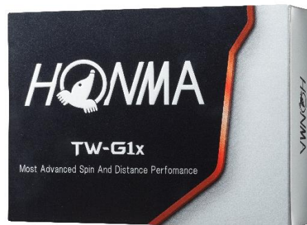
&lt;TOUR WORLD TW-G1x&gt;