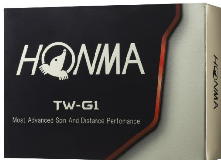
&lt;TOUR WORLD TW-G1&gt;

充份滿足熱血球友嚴格要求與期待的「TOUR WORLD TW-G1」系列高爾夫球，自 2014 年推出以來深受廣大熱血球友的喜愛。這一次 HONMA 更進一步將熱血球友致力追求的「驚人的飛行距離性能」、「競技場上的優異旋轉性能」、「絕佳的操控性能」升級再進化，以 NEW 『TOUR WORLD TW-G1』『TOUR WORLD TW-G1x』之姿全新登場。