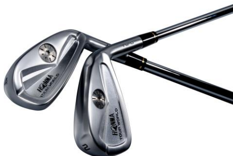
<HONMA TOUR WORLD—U>