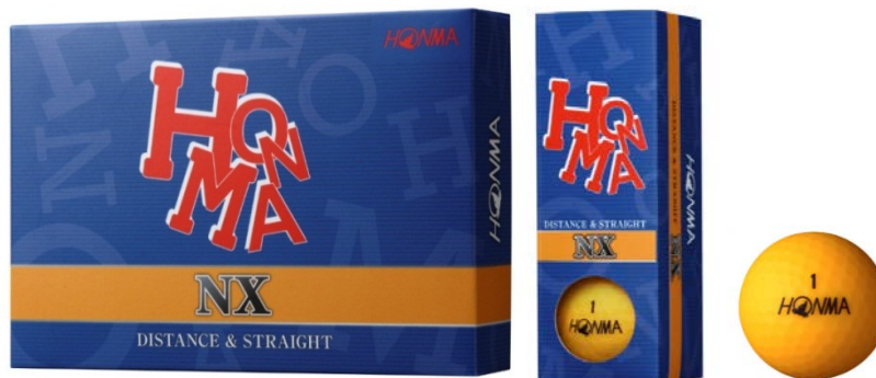
『HONMA NX』 (顏色：橘色)