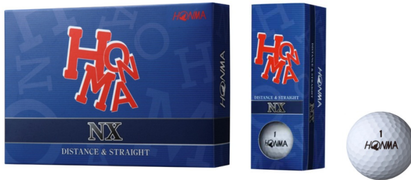
『HONMA NX』 (顏色：白色)