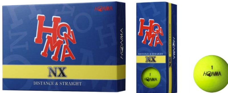
『HONMA NX』 (顏色：黃色)