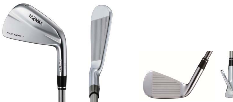
TOUR WORLD TW-BM