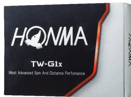
<TOUR WORLD TW-G1x>