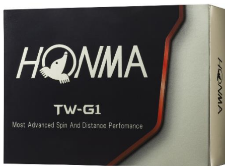
<TOUR WORLD TW-G1>

以回应热忱型球友们高要求为概念的「TOUR WORLD TW-G1」系列，自 2014 年发售以来深受众多竞技型高尔夫球友们的爱戴。针对众多的热忱型球友所追求的「球距性能」、「使用短杆时的旋转性能」、「操控性能」，又完成了更大的进化，NEW『TOUR WORLD TW-G1』『TOUR WORLD TW-G1x』将全新上市。