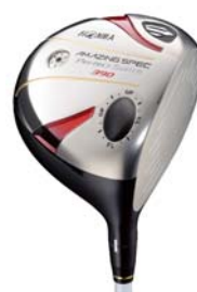
Perfect Switch ドライバー390タイプ

『Perfect Switch ドライバー390タイプ』、『Perfect Switch フェアウェイウッド』、『Perfect Switch ユーティリティ』、『BERES PRO IP』の詳細につきましては、次頁以降をご参照下さい。