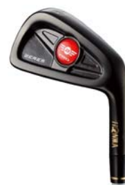
BERES PRO IP