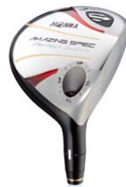
Perfect Switch フェアウェイウッド