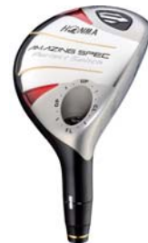
Perfect Switch ユーティリティ