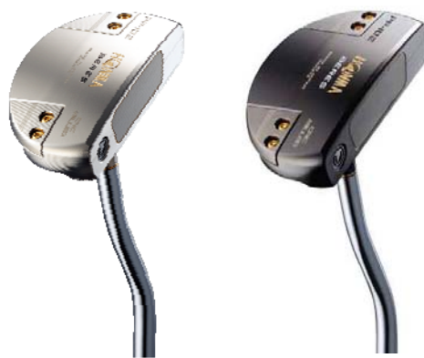
光沢ニッケルプラチナ色