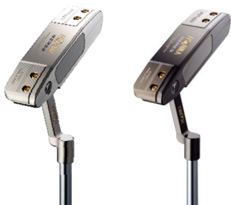
光沢ニッケルプラチナ色