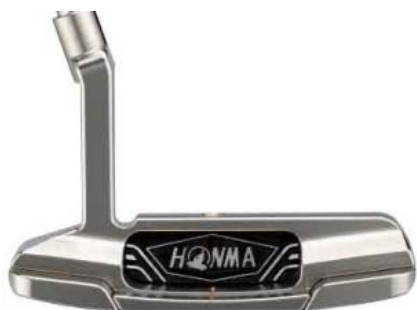
<バックフェース画像>