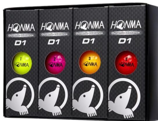
HONMA D1 マルチカラーモデル