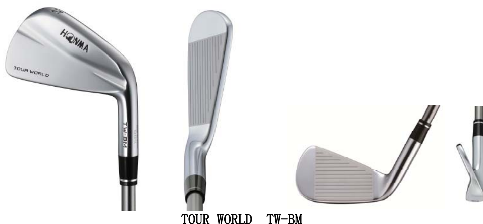
TOUR WORLD TW-BM