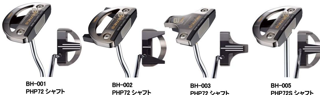
BH-001 PHP72 シャフト

さらに、商品ラインナップは、4タイプをご用意し、お客様のフィーリングに合ったタイプをお選びいただけます。