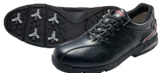
ブラック/ブラック