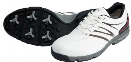
ホワイト/ブラック