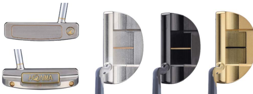
<BERES PP-202 推杆（槌型）>