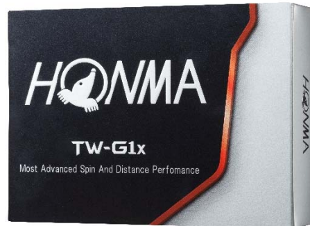
<TOUR WORLD TW-G1x>