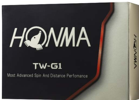
<TOUR WORLD TW-G1>

열의계 골퍼의 다양한 요구에 대응하기 위해서, 「TOUR WORLD TW-G1」 시리즈는 3년 전, 2014년도 발매 이래로 중급자, 상급자의 골퍼들에게 많은 사랑을 받아왔습니다. 모든 열의계 골퍼가 추구하는 「비거리 성능」, 「스핀 성능」, 「컨트롤 성능」을 향상시키기 위해 개발, 진화 시켜 NEW 『TOUR WORLD TW-G1』, NEW 『TOUR WORLD TW-G1x』 를 발매합니다.