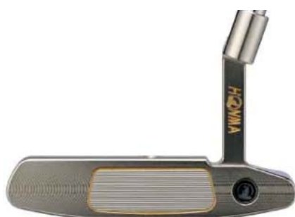
< 桿面照片 > 光澤鎳鉑上色