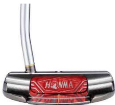
< 桿面背面照片 > 光澤鎳鉑上色