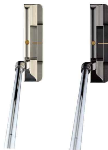
< 握桿時照片 > 光澤鎳鉑上色 光澤黑鎳刷面