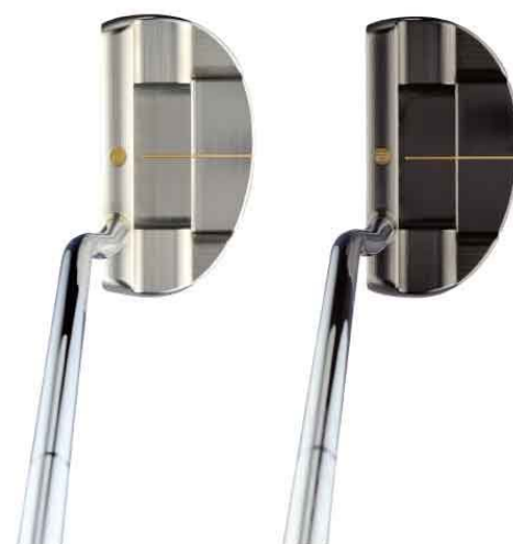
< 握桿時照片 > 光澤鎳鉑上色 光澤黑鎳刷面