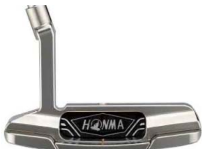
< 桿面背面照片 > 光澤鎳鉑上色