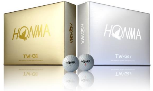
좌 : 『TW-G1』 우 : 『TW-G1x』