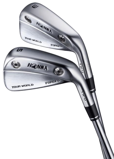
&lt;TOUR WORLD TW-U FORGED&gt;