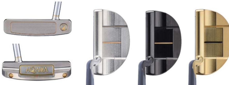
<BERES PP-202 퍼터 (말렛) >