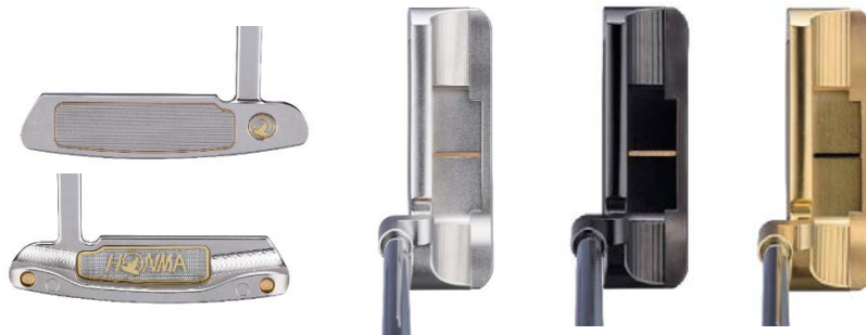
<BERES PP-201 (블레이드) >