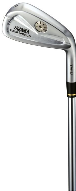
#4 杆面倾角 24°