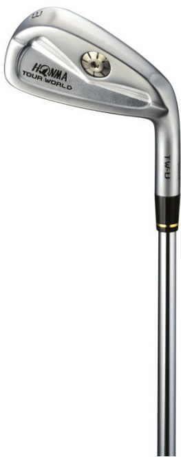
#3 杆面倾角 21°