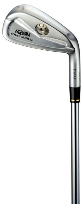
#2 杆面倾角 18°